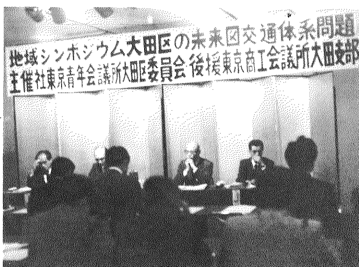
於・蒲田駅ビル ステーションホール

21世紀には四つの大きな波が地方を（大田区は東京の中でも位置的にも地方である）襲うだろうと